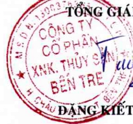
ĐẶNG KIẾT TƯỜNG