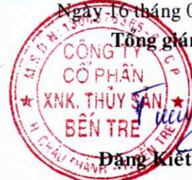
Đặng Kiệt Tường